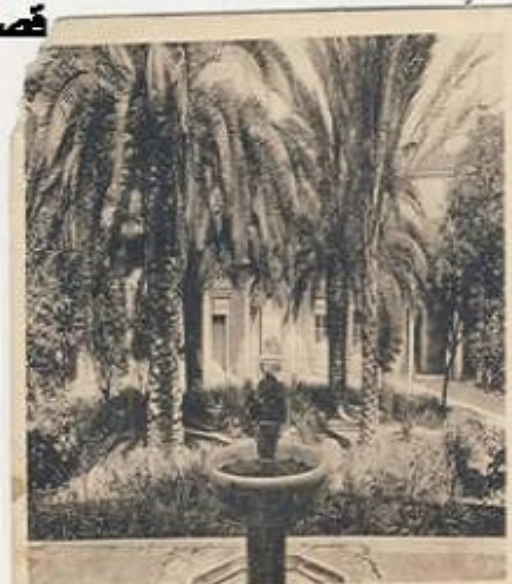
LA MANOUBA - Tunisie - La Fontaine d'Oron avec Palmiers