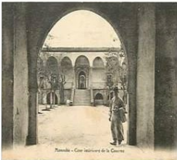
Manouba - Cour intérieure de la Casse