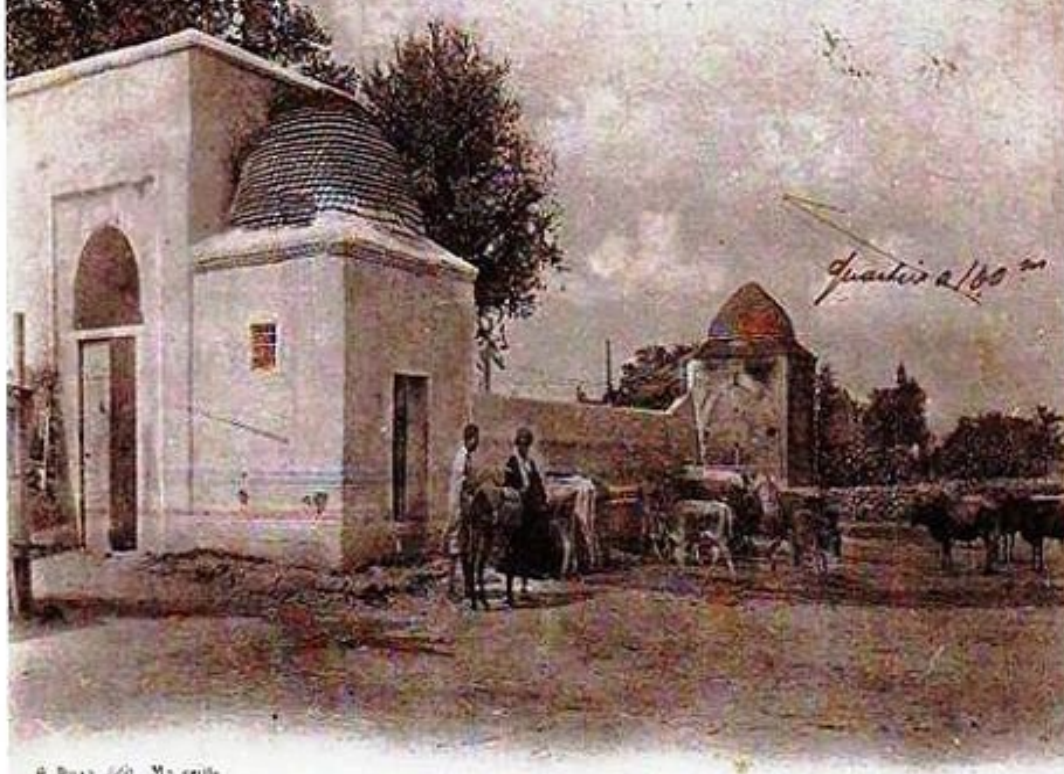
2 - MANOUBA - Abreuvoir

وعلى يسار مبنى السقاية، يوجد حوض مائي ذي استتالة وقليل العمق، لجمع الماء القلح من فوهة السبيل، وفي أقصى الحوض بني مجلس مربع الشكل في شكل نكتة للاستراحة وتوج أحد مقاعده بقوس نصف دائري غائر للتظليل. وبالجهة الجوفية يوجد حوض مائي ثلثي ذي استتالة يتعلمد مع الحوض الأول. وبالناحية الشمالية الشرقية توجد بناية البئر ذات ناعورة تعمل على استخراج الماء الصالح للشرب عن طريق الدواب.