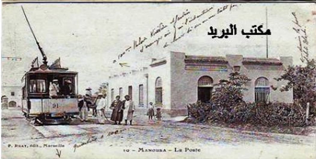
10 - MANOUBA - Le Poste